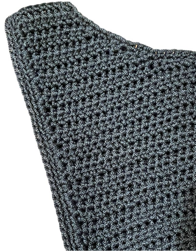
Unire i pannelli lateralmente a mb

Fare un giro di scontorno a mb attorno a tutto il perimetro del corpo borsa.