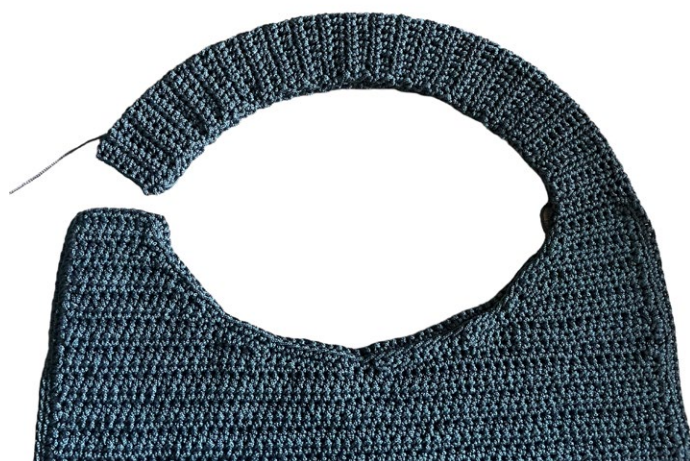
Realizzare il manico partendo da una estremità del corpo borsa.