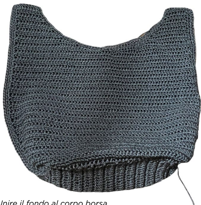
Unire il fondo al corpo borsa