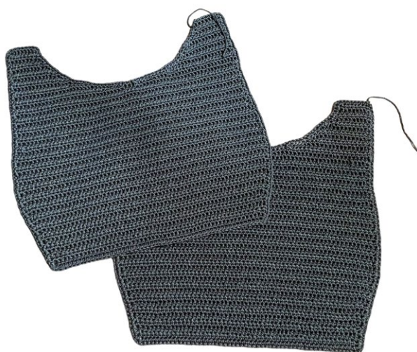
I due pannelli che compongono il corpo borsa